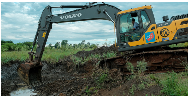
Se sumó al parque vial una nueva excavadora, que permitió la construcción de más de 500 reservorios de agua en el sur de Misiones.

Como año a año se realizaron los estudios periódicos correspondientes al personal de la entidad, además de las Capacitaciones de Seguridad e Higiene Laboral, que se realizan regularmente con los distintos equipos de trabajo en territorio, además de provisión de las vestimentas y medidas de seguridad reglamentarias. Este año se articularon acciones en conjunto con el Servicio de Enfermería del Instituto de Previsión Social (IPS) sobre Hipertensión Arterial y Nutrición. Por su parte, el área de psicología realizó el acompañamiento a todos los equipos o individuos quienes requirieron una orientación o apoyo, generando una espacio de diálogo seguro y cercano.