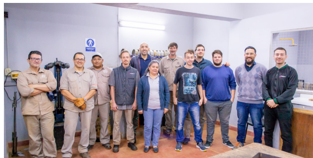
El equipo del Laboratorio Vial realiza investigaciones vinculadas a suelos, asfalto y hormigones que son utilizados en las obras.