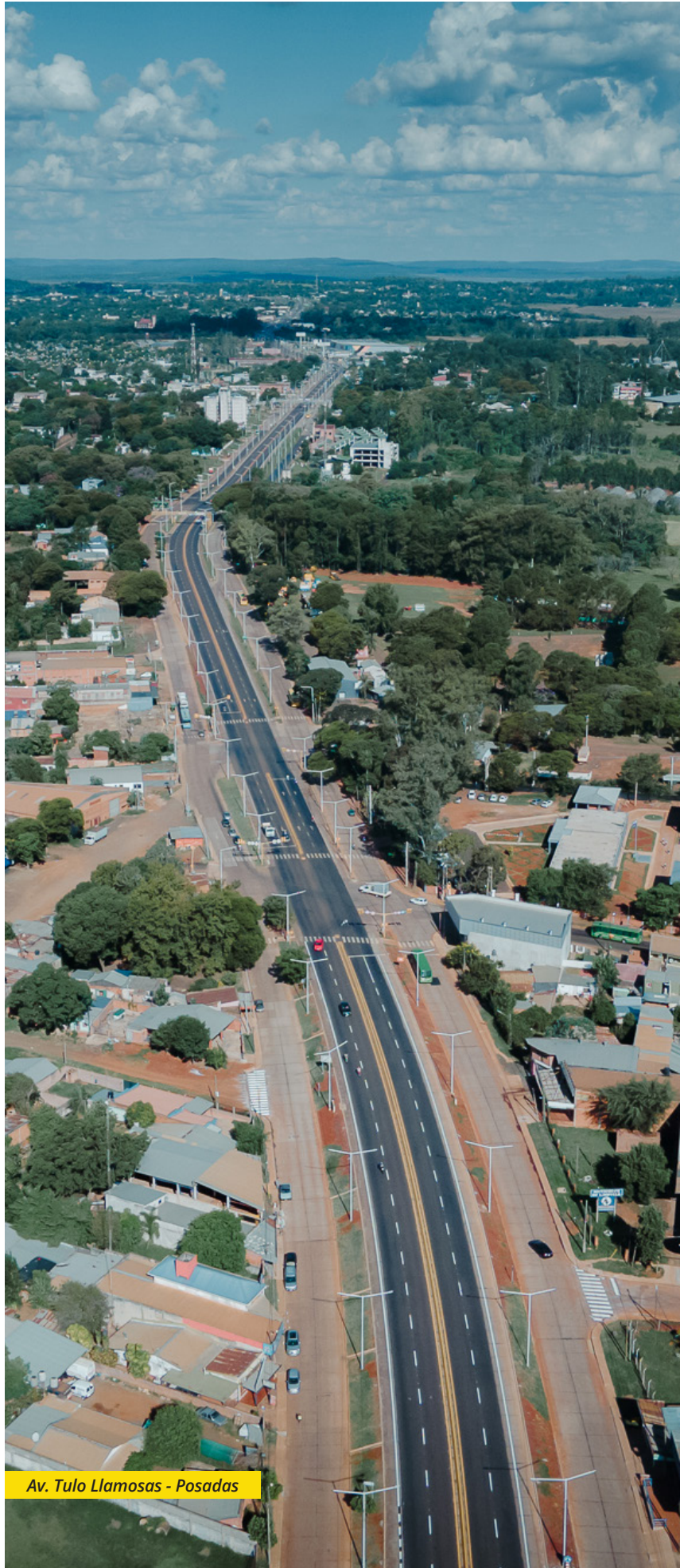
Av. Tulo Llamosas - Posadas

“Es fundamental contribuir a consolidar una cultura en la que cada persona se sienta valorada y parte esencial de esta institución que genera grandes transformaciones en las condiciones de vida de los misioneros”, explicó Macías y concluyó: “para mí es un orgullo ser un trabajador vial”.