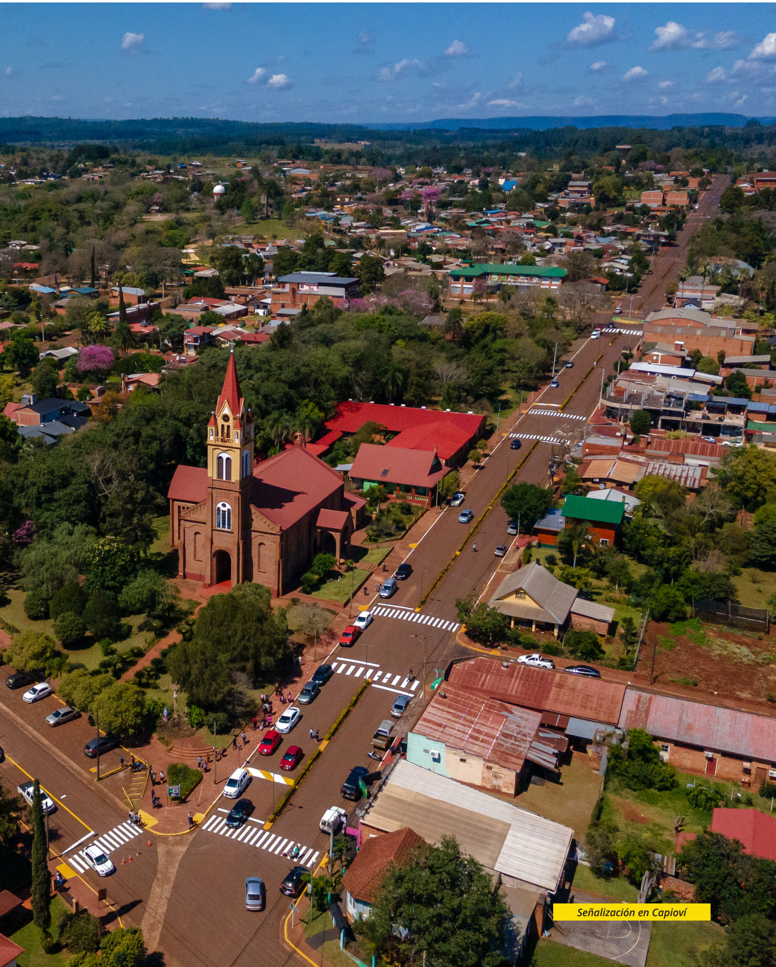
Señalización en Capióv