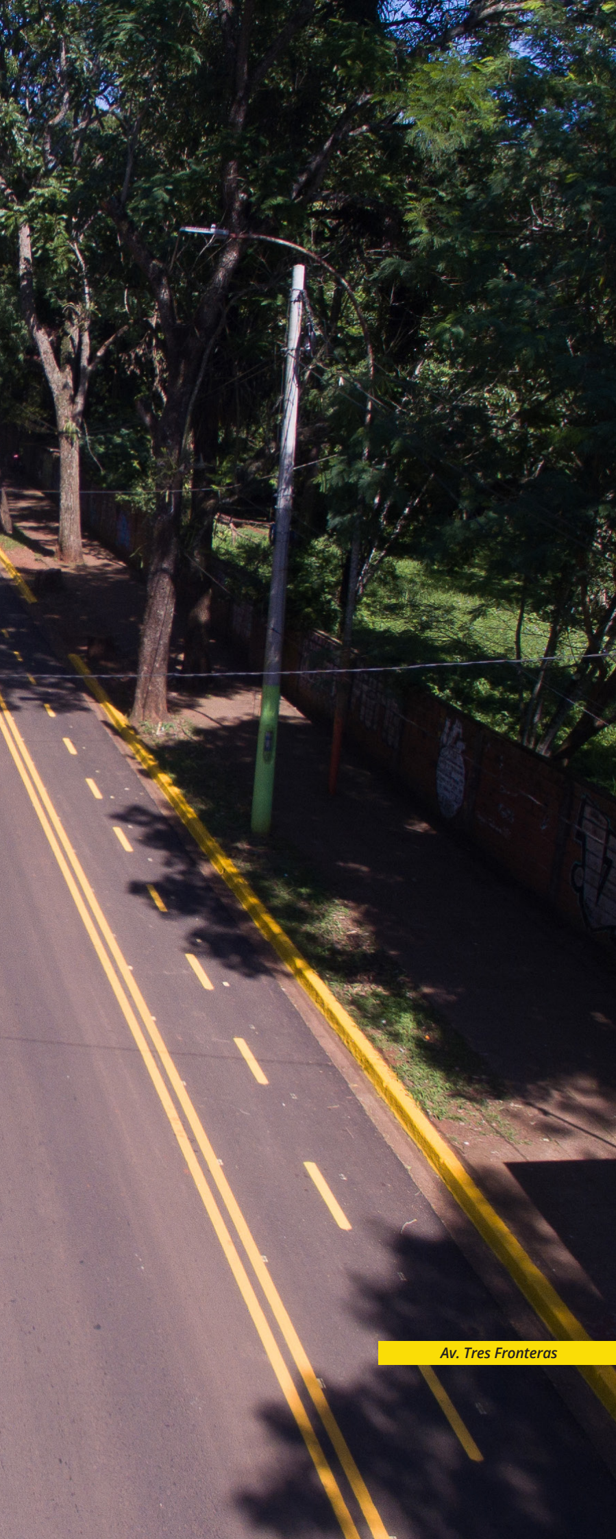
Av. Tres Fronteras

E l Master Plan de Obras Viales para la localidad de Puerto Iguazú, financiado por el Gobierno de Misiones, se encuentra actualmente en plena ejecución. Como parte del mismo, la Dirección Provincial de Vialidad (DPV) está trabajando en estrecha coordinación con el municipio para llevar a cabo proyectos de infraestructura vial con el objetivo de mejorar la circulación del tránsito y la integración de la trama urbana, agilizando los accesos y la conectividad entre los diferentes barrios. Esto contribuye a proporcionar condiciones más favorables para el desarrollo de la localidad y a elevar su estatus mediante la implementación de servicios adicionales.