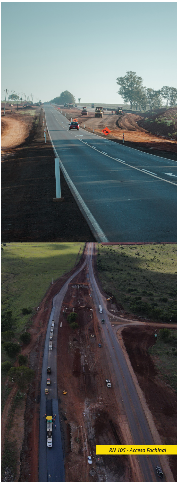
RN 105 - Acceso Fachinal

Una vez finalizada, la RN 105 contará con una nueva calzada que tendrá dos carriles por sentido de circulación, un separador tipo New Jersey a lo largo de todo el tramo, así como puentes y rotondas adicionales, junto con una nueva infraestructura en la zona de la Estación de Peaje de Fachinal. Esta nueva autovía servirá para conectar las dos principales rutas nacionales en Misiones: desde el municipio de Garupá sobre la RN 12 hasta el municipio de San José en la RN 14.