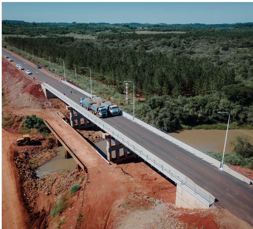
(Arriba) Prueba de cargas en el puente del Arroyo Tunas, se observa a la izquierda el antiguo puente ya demolido. (Abajo) Puente finalizado

Los trabajos también han involucrado la reubicación del tendido eléctrico así como la preservación y reemplazo de árboles nativos para mantener el entorno natural.